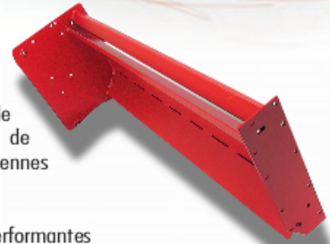
Châssis pour machine agricole