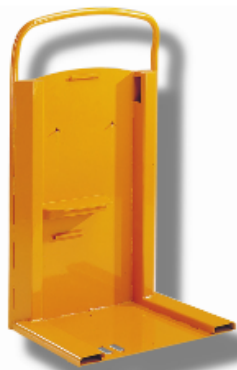
Plateforme conducteur gerbeur électrique

Qualité des équipements, niveau d'investissement soutenu, performance des équipes, COMEBO Industries se distingue en mettant en avant, trois indicateurs :